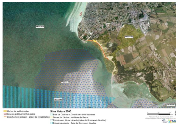
Carte 3 : Situation du projet vis-à-vis des sites Natura 2000